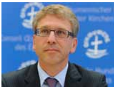
Olav Fykse Tveit

Aufbruchsstimmung in Genf: Am 27. August haben die Mitglieder des Zentralausschusses des Ökumenischen Rates der Kirchen (ÖRK) den 48-jährigen Norweger Olav Fykse Tveit zum neuen Generalsekretär gewählt.