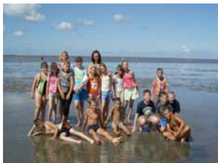
Im Watten in Cuxhaven-Berensch