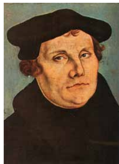
Dr. Martin Luther

Der Augustinermönch Luther wollte die Kirche erneuern und sie zur Botschaft des biblischen Neuen Testaments als ihrem geistigen Ursprung zurückführen. Heute ist der Reformationstag nur in den neuen Bundesländern, nicht aber in Berlin und im alten Bundesgebiet