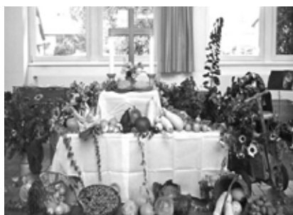
Erntedankaltar in Hagen

Am besten ist es, wenn Sie die Gaben am Samstagnachmittag ab 16 Uhr gleich zur Grundschule in Hagen bringen, ansonsten können sie auch in den Tagen vorher bei Bauer Peters oder – für die Stader – am Gemeindehaus bei der Kirche abgegeben werden.