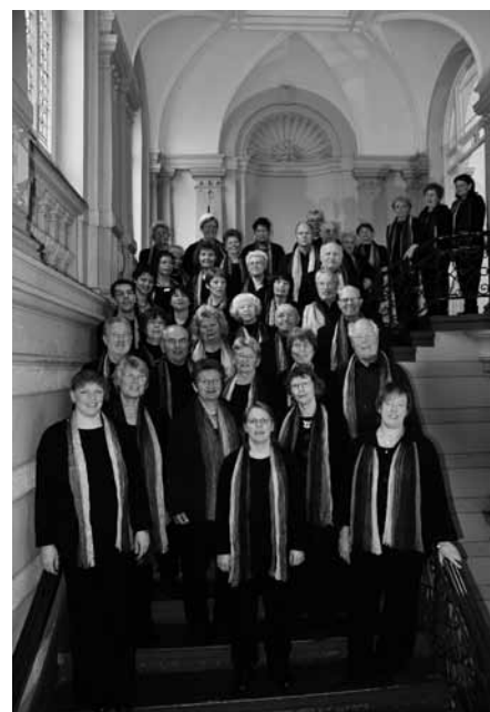
Chor Wiepenkathen e.V.